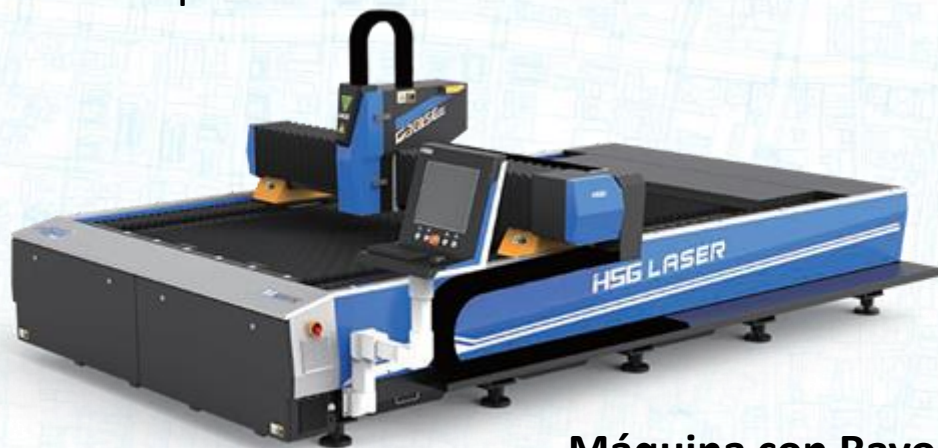
Máquina con Rayo de Fibra

6. De acuerdo con la norma EU, las máquinas laser que sean de corte por fibra deben estar protegidas con sus respectivas capotas de seguridad, esto con el fin de evitar que las personas tengan contacto directo con la visión, ya que, el rayo tiene una frecuencia de radiación demasiado fuerte que puede llegar a dejar ciega a una persona o tener mareos y en caso de una persona que sufra del corazón poder debilitarlo.