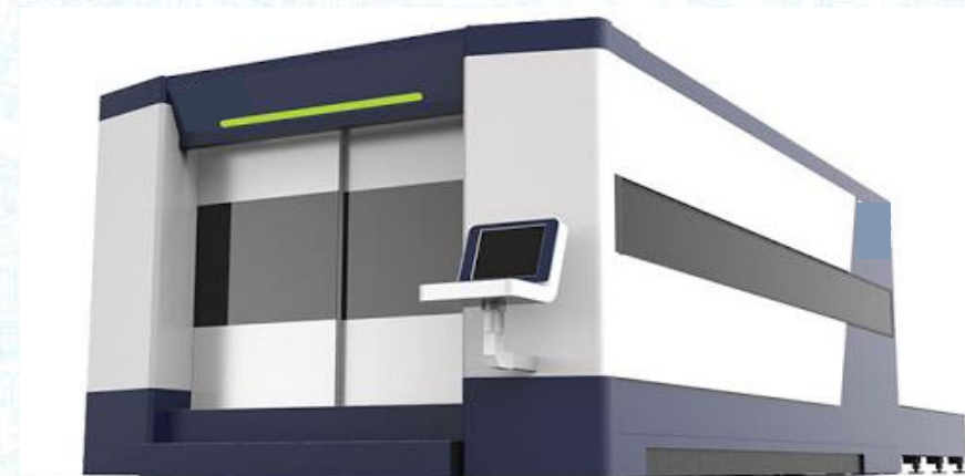
Máquina con ensamblaje y vidrios autorizados

*Por favor informar a la jefatura de proyecto el tipo de máquina laser que va a ingresar al recinto.